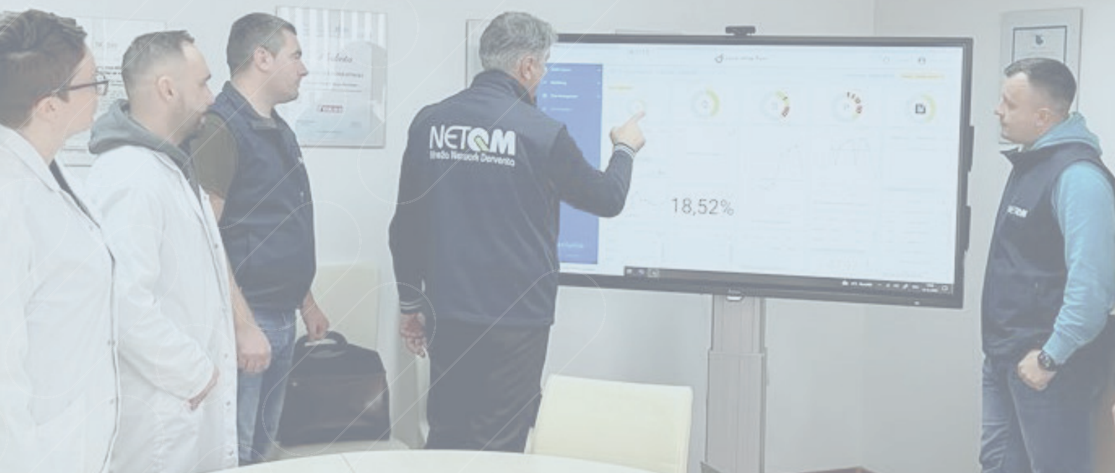
Fig. 4: © NetQM, Visual Shop Floor in pratica, Dashboard