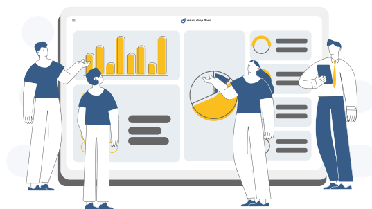
Fig. 3: Illustrazione Solunio: Shop Floor Meeting con Visual Shop Floor

Visual Shop Floor è diventato l'attore centrale di questo processo e ora è la nostra base per le fasi di ottimizzazione”.