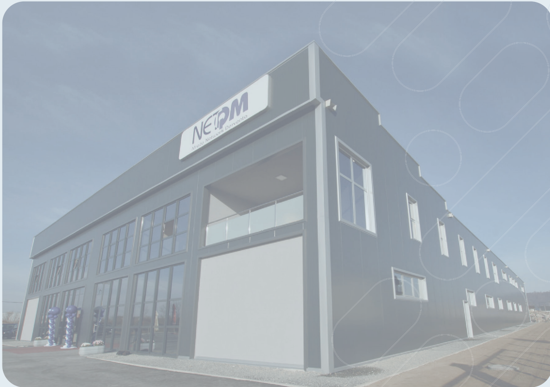
Fig. 1: © NetQM, Luogo di produzione, Bosnia url: https://www.karriere.at/f/network-quality-management